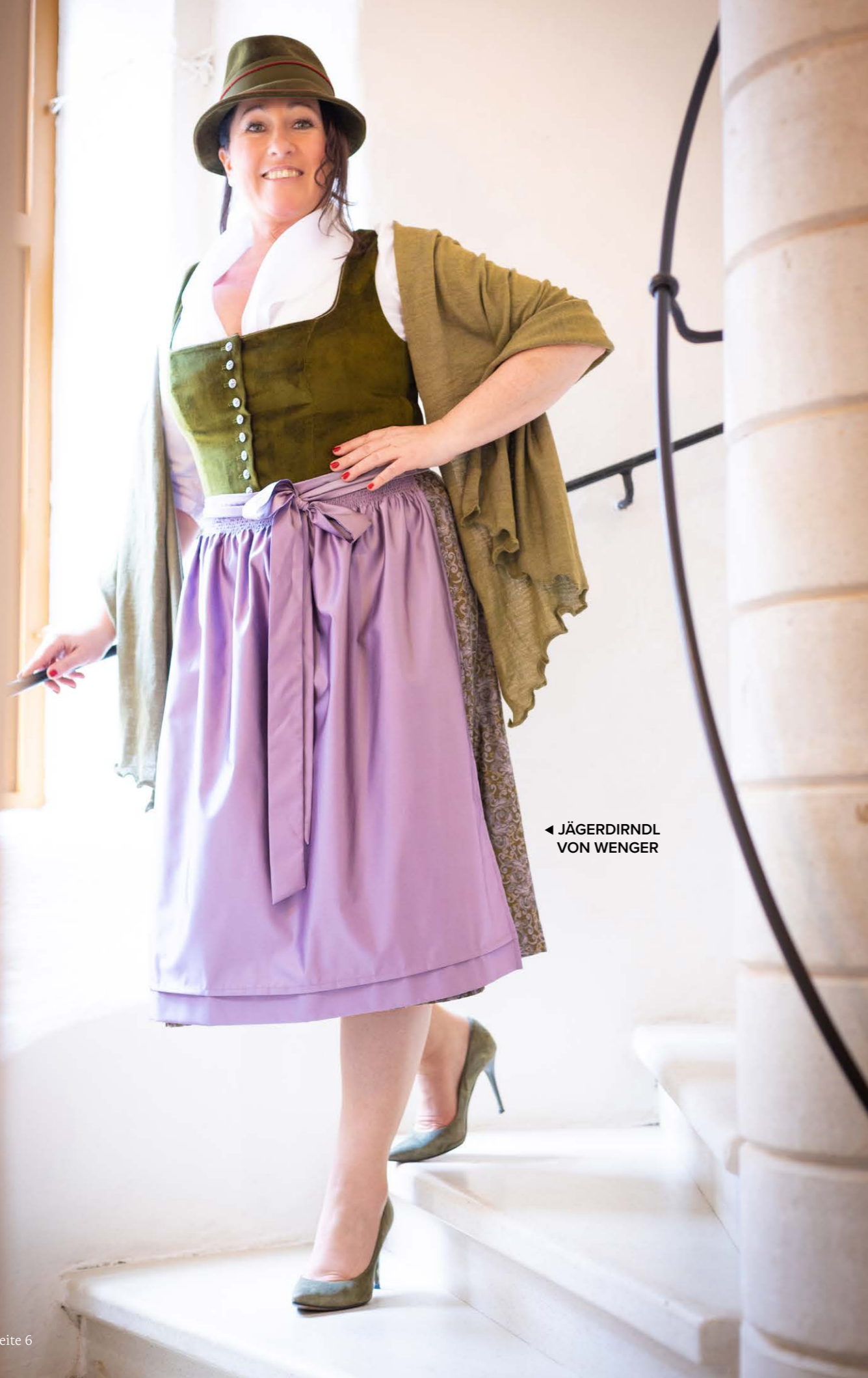
◀ JÄGERDIRNDL VON WENGER