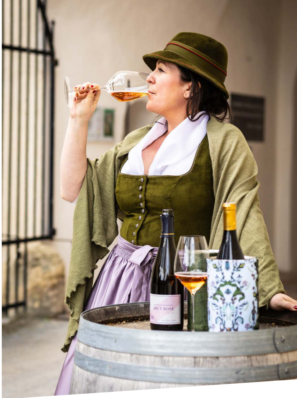
Weinkühler von TischArt in verschiedenen Designs unter www.tischart.at erhältlich