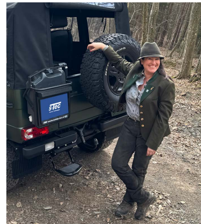
Jagdoutfit von Pressl - www.pressl.cc

Trotz ihrer vielen Reisen und Abenteuer ist die viel beschäftigte Jägerin auch gerne zu Hause, in ihrem Heimatrevier in den niederösterreichischen Voralpen wo sie jagdlich aufgewachsen ist. In Hohenberg im Bezirk Lilienfeld in Niederösterreich werden die Jagd und die Traditionen rundherum noch großgeschrieben und ihre Freizeit verbringt sie so liebend gerne auf Jägerinnenausflügen, auf den vielen jagdlichen Veranstaltungen wie z.B. der bekannten Hubertusfeier oder einfach beim Jägerstammtisch am Sonntag nach der Kirche. Dies ist ihre Art die zahlreichen österreichischen Jagdtraditionen zu bewahren und auch in die Welt hinauszutragen, besonders die Jagdsprache. Die Intention dahinter ist für die „Huntress“ ganz klar: es sollen noch viele Generationen nach ihr die Jagd mit ihren zahlreichen Facetten pflegen und genießen können.